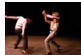
La scena per conoscersi.

Gruppo psicoterapeutico di tipo Psicosintetica in relazione all'Arte Drammatica: relazione, consapevolezza, il corpo, la voce, lo spazio/ tempo, l'interpretazione di ruoli. OBIETTIVI: Accettazione di se e rafforzamento dell'auto stima - Conoscenza dei propri limiti e delle proprie potenzialità - Gestione dell'ansia e della paura. Un'incontro di 2h a settimana su appuntamento