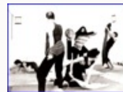
Il gruppo crea osservato dal pubblico che fa da specchio

Un corso di teatro per conoscere e divertirsi, imparare la libertà di giocare diversi ruoli sul palcoscenico, confrontandosi con la fantasia di autori diversi in tempi diversi. Un corso aperto a tutti, attraverso i fondamentali dell'Arte Drammatica si volerà ad una messa in scena in teatro. Una volta a settimana, 3h di lavoro - iscrizioni aperte -