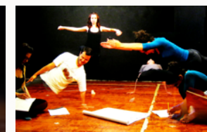
Espressività corporea, il non verbale.